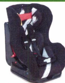
Автокресло группы I для детей массой 7-18 кг